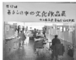
第17回亀岡支部暮らしの中の文化作品展風景