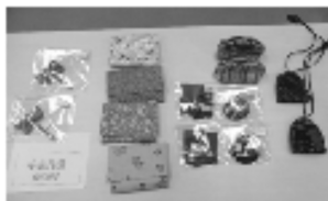
写真上・作品展風景左はリース作り 下・手芸作品