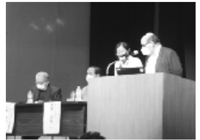
世界の高齢者との大交流会

最大の社会組織で国外でも27の国に組織を持っています。全国、州地域組織のほか草の根として「リーグ」があります。「リーグ」は地域と密接にかかわり、政策の重要な中心です。日本の中央、府県、支部と同じような形態です。本社はローマで政治的・組織的な活動をされています。同組合は、すべての高齢者の利益を代表し、特に個人の基本的権利が常に認められ、差別のない社会において「男女平等の連帯」の価値を確認しあっています。