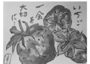
絵手紙 城陽支部 河端允子さん(左)