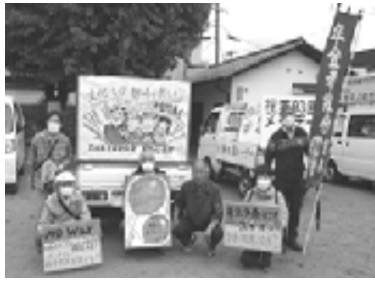
昨年のメーデー参加後の写真

福知山支部は1989年(平成元年)5月1日に結成されました。当初は福天支部(1市3町)の名称でしたが、2007年の市町合併に伴い福知山支部として名称変更されました。現在、組合員数は195名でほぼ男