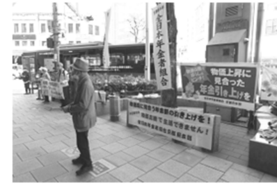
Raise your Pension 年金上げて