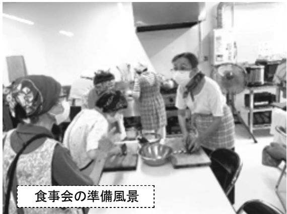
食事会の準備風景

女性部が中心に活動 本年11月1日現在組合員数は209人です。うち女性組合員数は134人です。三分の二近くになり活動は女性が